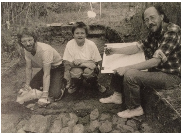
Bild från någon av Utgrävningarna på Husberget åren 1979, 1986 eller 1989

Lidéns utgrävningar visade att borgen raserats eller bränts tre gånger, varav två gånger under strid. Efter den sista branden i slutet på 1300-talet byggdes borgen aldrig upp igen.