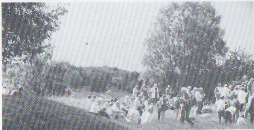
I den våna grönskan bland Birkas gravhögar ses här en liten del av den 300-hövdade skaran.

Fredagen den 16 juni blev en minnesrik dag för hembygdsföreningarna i Eskilstuna kommun. Inte mindre än 300 deltagare styrde då i två båtar, Hjelmare Kanal och Björnön ut från hamnen i Torshälla med destination Birka och de där pågående utgrävningarna.