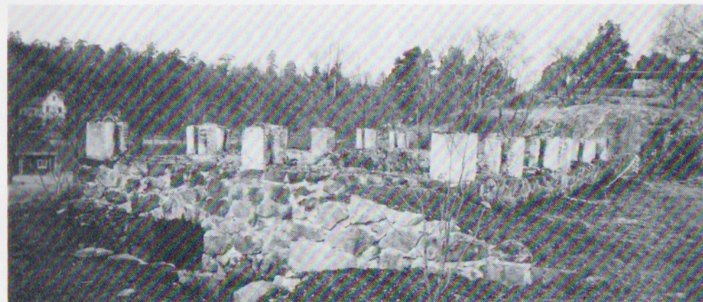
Det som återstår av "Krutladan" blir nu bevarat som ruin.

Som bekant brann "Krutladan" i Nyby ned den 26 januari 1991 till stor sorg för många, inte minst för oss i hembygdsföreningen. Vi betraktade den som ett betydelsefullt minne från Nybyepoken och den på den tiden viktiga framställningen av salpeter för kruttillverkning.