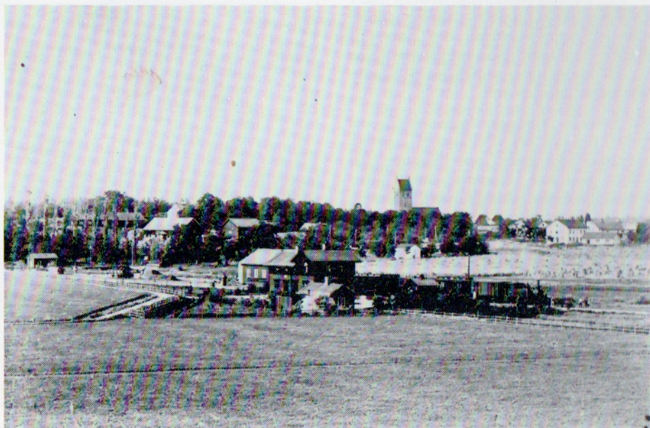
En av de många vyerna i Georg Nyströms intressanta bildarkiv.

Denna fina bild av Torshälla sedd väster ifrån, togs i början av seklet av fotografen och konstnären Georg Nyström. Fotografen har stått med kameran vid Granbacken.