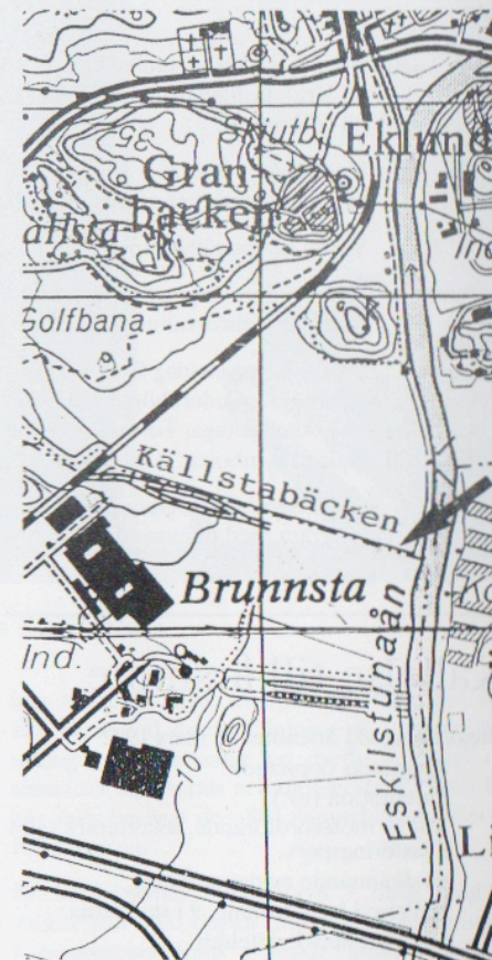
Ungafär vid pilen, väster om ån, kan våtmarksområdet komma att ligga.

Inte heller när det gäller planerna på att skapa våtmarker i anslutning till Källstabäcken finns