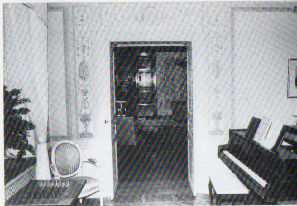
Ett par av de vackra rummen i Nyby herrgård.