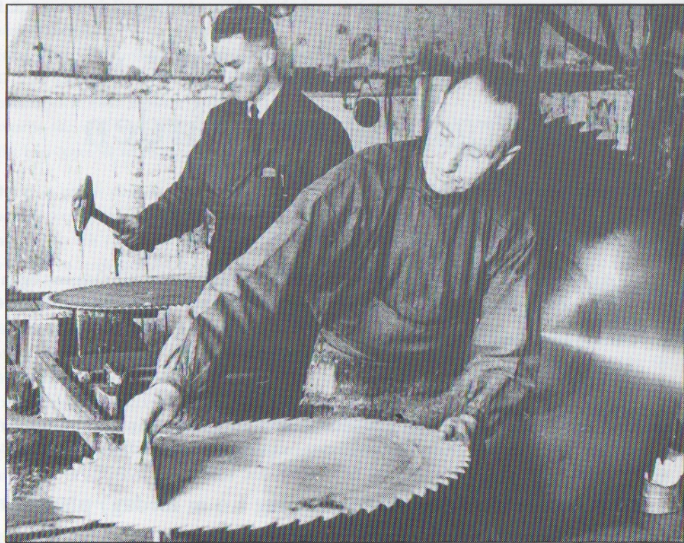
Det är sådana här bilder från gamla Torshälla industrier som cirkeln gärna vill få låna. Här en interiör från Alissons Sågbladfabrik. Kan någon l'ö upplys om vilka herrarna på fotot är.

ningar. Det kan vara företag som hotas av nedläggningar, där vi måste dokumentera dagsituationen men också där äldre fotografiskt material och andra arkivalier hotas av uppsplittring, kassering och förstörelse hos familjer eller