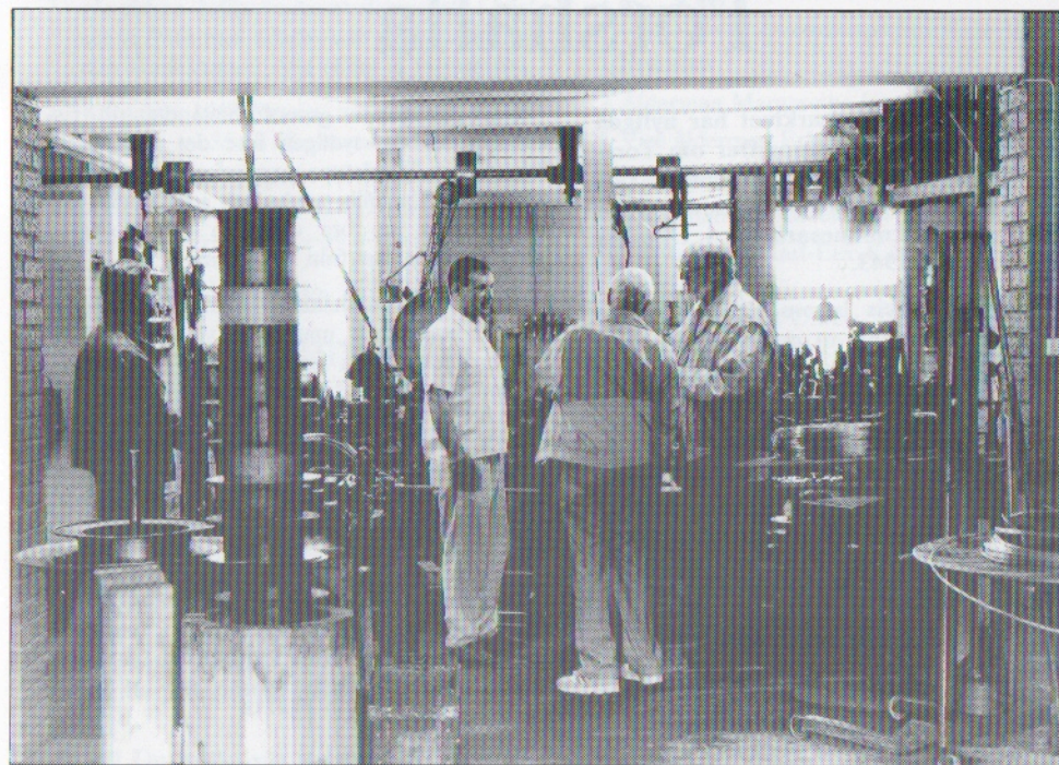
Cirkeldeltagarna hade mycket intressant att se på vid studiebesöket hos Pettersson & Hellberg Järnmanufaktur.

enskilda pga dödsfall, skilsmässa eller liknande.