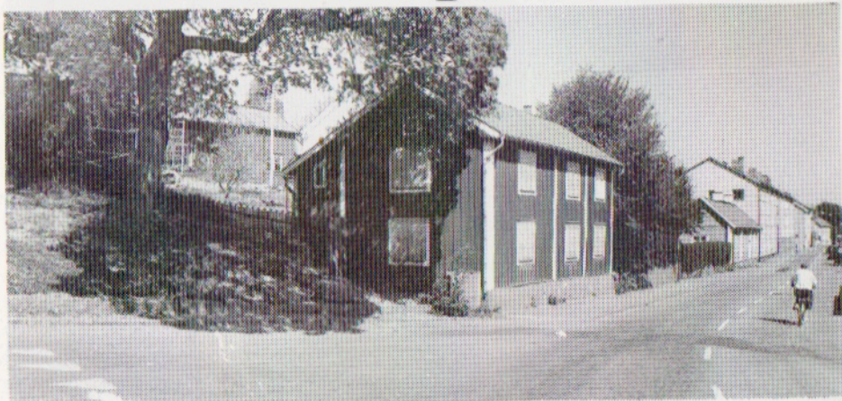
Det här välkända huset är nu borta ur gatubilden men ska snart återuppstå.

Den gamla bostadsfastigheten i kvarteret Apotekaren 1, belägen i hörnet av Storgatan och Rådhusstorget, har i många år varit en "het potatis". Länges har rivningshotet vilat över det gamla timmerhuset. Torshälla fastighets AB, som ett tag ägde fastigheten, ansåg att den var i så miserabelt skick att den inte kunde räddas. Nu har det likväl skett.