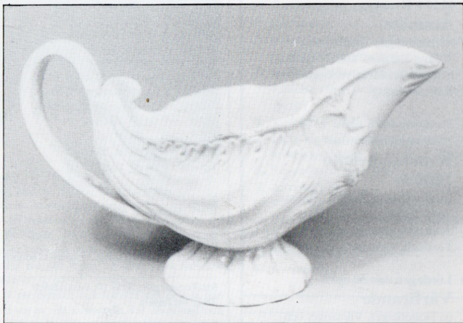
Den 200-åriga eleganta gräddsna.

▫ Bland de föremål som Georg Nyström berikat hembygdmuseet med finns en liten gräddsna i flintgodsporslin.