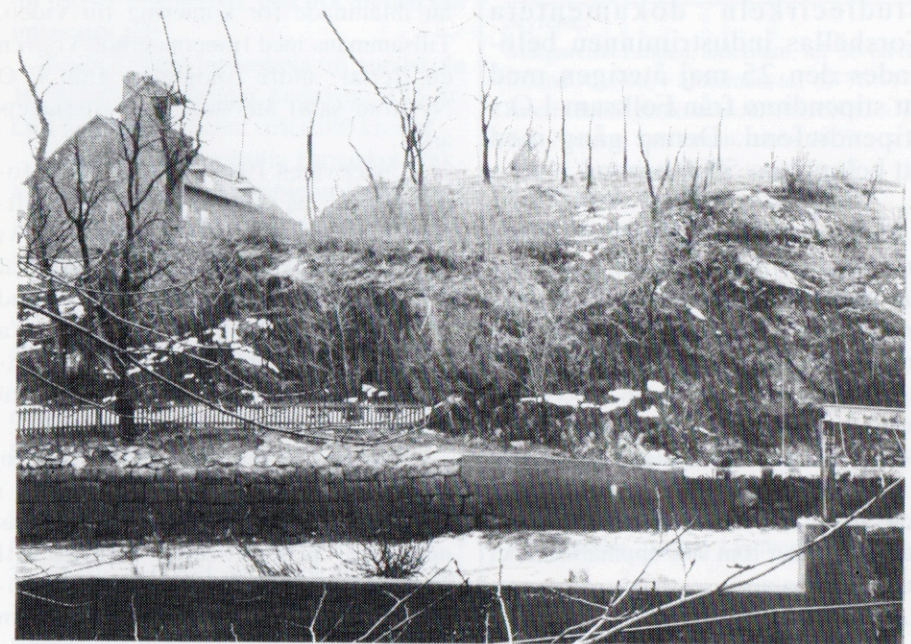
Husberget är ett exempel på objekt som kan intressera både elever och lärare. Det visar också hur en hembygdsförening kan bidra till att genom ekonomiskt anslag berika stadens i stor utsträckning okända historia under medeltid.

Under vårterminen 1994 gjorde klass 5 E Edvardslundsskolan en klassutflykt till Husberget - den medeltida borganläggningen i stadens centrum. Utflykten föregicks av en kort introduktion till borganläggningen i klassrummet samt visning av videofilmen om utgrävningen vid Husberget.