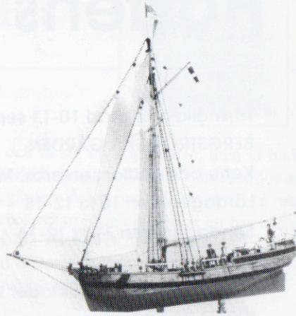
Originalen till S:ta Brita kanske ligger mer eller mindre intakt på botten av Vätern i trakten av Mellerud.

Av en annan lokalhistorisk forskare i Vänerområdet har vi fått kännedom om