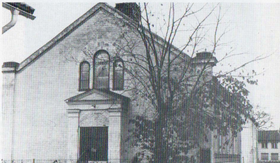
Missionskyrkan fotograferad någon gång på 1980-talet.

Lilla gatan i Torshälla domineras i var sin ända av ett par särpräglade och ganska monomentala byggnader. I södra delen hittar man f d Missionskyrkan och norr om Rådhusstorget f d Baptistkyrkan. Äldst av de båda är Missionskyrkan, som invigdes 1888, medan Baptistkyrkan stod klar 1891.