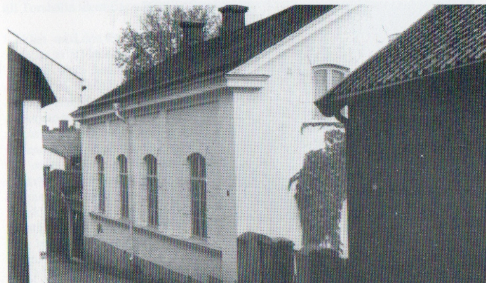
Baptistkyrkan är till sin exteriör helt bevarad som då den en gång byggdes.

Lokalfrågan var emellertid mycket brännande. Under ett par år fick man disponera några rum på andra botten i f d apoteket, alltså det stora huset snett emot kvamen. I folkhumorn fick det namnet "Himmelriket" i motsats till krogen mitt emot som kallades "Lilla helvetet" ("Lill Jans krog"). År 1886 inköptes emellertid gården nr 60 vid Lilla gatan av grosshandlare E Hellstedt. Där uppfördes alltså den gedigna