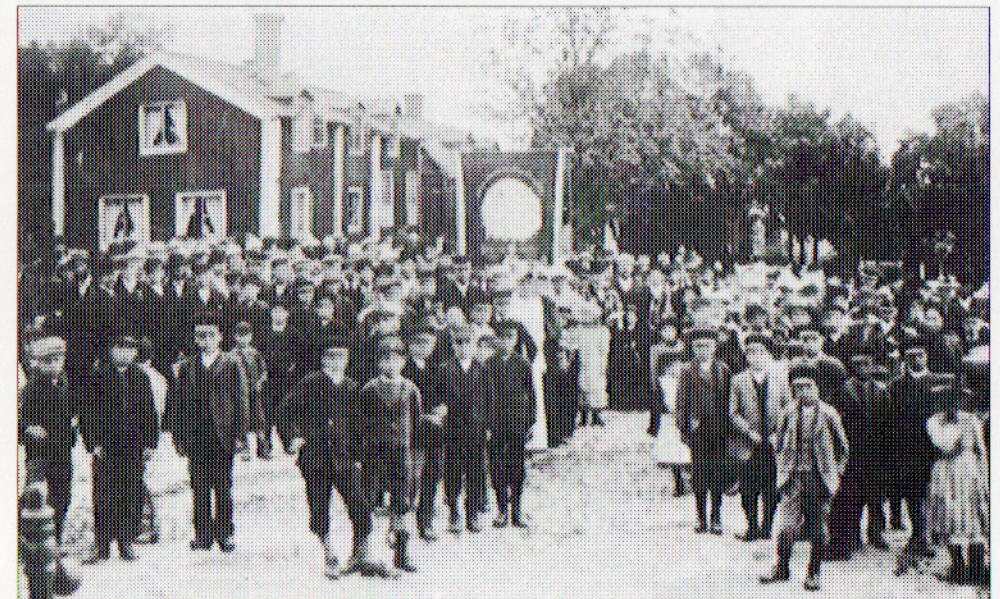
Demonstration på torget omkring sekelskiftet. På bilden syns Logen 47 Frids standar och dess första fastighet.