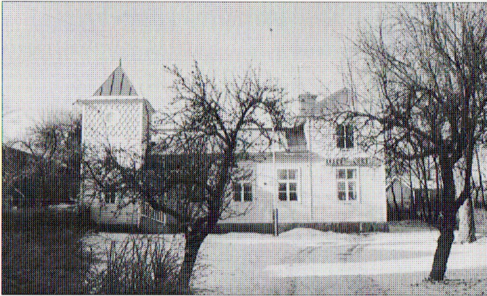
IOGT-NTO:s ordenshus fotograferad i januari 1996.