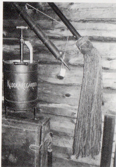
Brandredskap från 1700-talet o. yngre tid i Bergströmska gården.

I det egentliga släckningsarbetet har brandsprutan alltid spelat en viktig roll. Allt sedan antiken har en enmansspruta funnits (se bilden) och man vet att den har an-