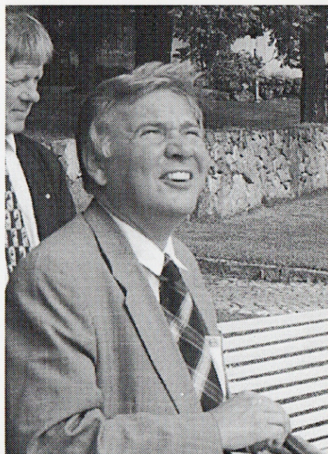
Vad tittade Landshövdingen på när han var i Torshälla? (Jo, Torshälla stads flagga)

Efter besök i rådhuset och kyrkan blev det kaffepaus och rundvandring på Bergströmska gården. Sedan gick man via kvarteret Borgmästaren ner till Kvarnen och Lärcenter och avslutade förmiddagen på Medborgarkontoret.