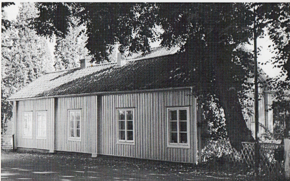
Hellbergska gården på Järnvägsgatan

År 1859 köpte f. d. gardisten nr 44 vid Kungl. Lifgardet Carl Fredrik Hellberg gården nr 40 vid Västra Tullgatan nuv. Järnvägsgatan.