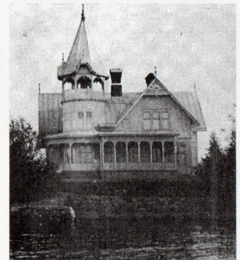
Brävalla från sjösidan