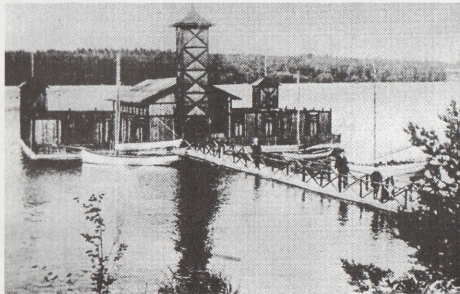
Badhuset vid Mälarbaden kring sekelskiftet