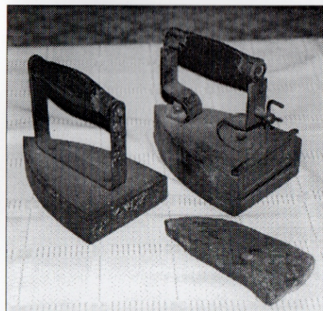
Bild 2. Strykjärn för uppvärmning på spis och strykjärn med lod.